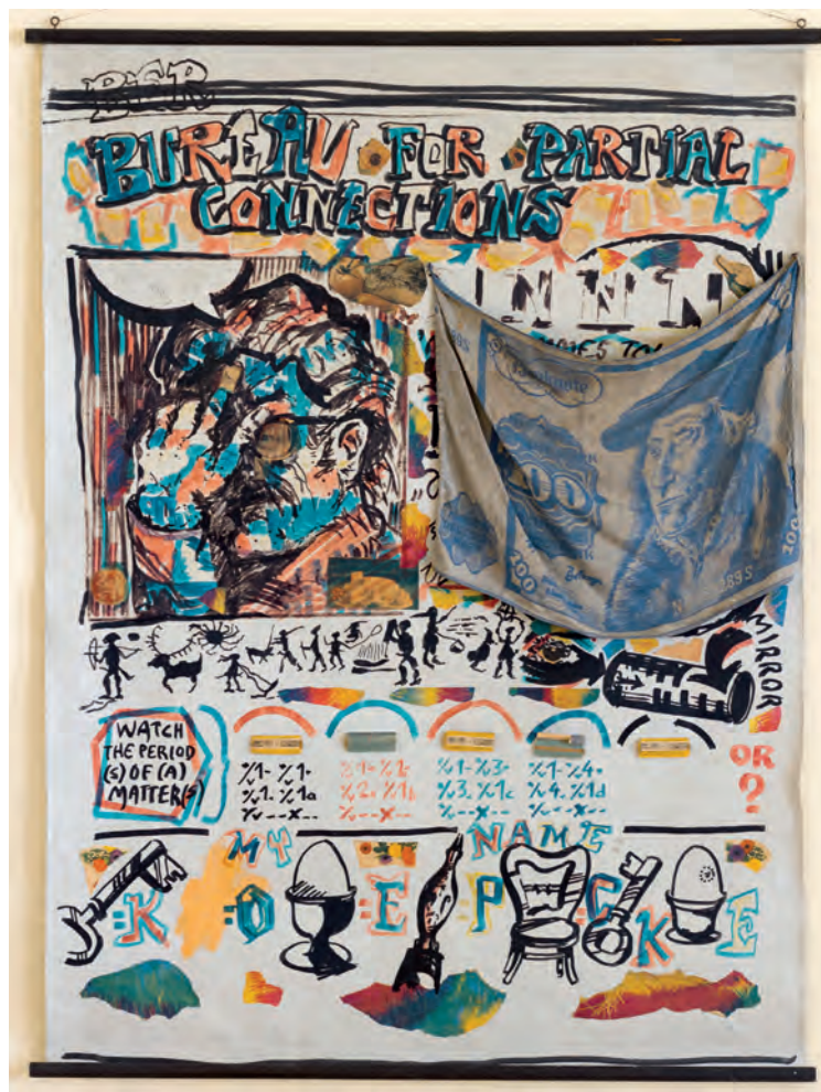
Bureau for Partial Connections 1972

Olie og collage på film lærred 150 x 110 cm Afbilledet i Kunsthøst Charlottenborgs katalog "Action and Remains" Al Hansen & Arthur Köpcke som nr. 170, s. 234