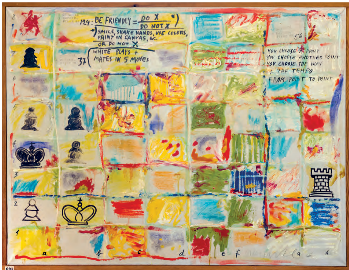
Piece No 37 + 124 + 56 in the series of the Read/Work Principles 1965

Olie og tusch på lærred 63 x 83 cm Afbilledet i Kunsthal Charlottenborgs katalog "Action and Remains" Al Hansen & Arthur Köpcke som nr. 248, s. 277